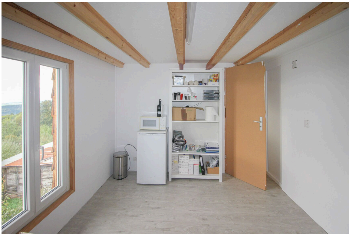
Rural - bureau