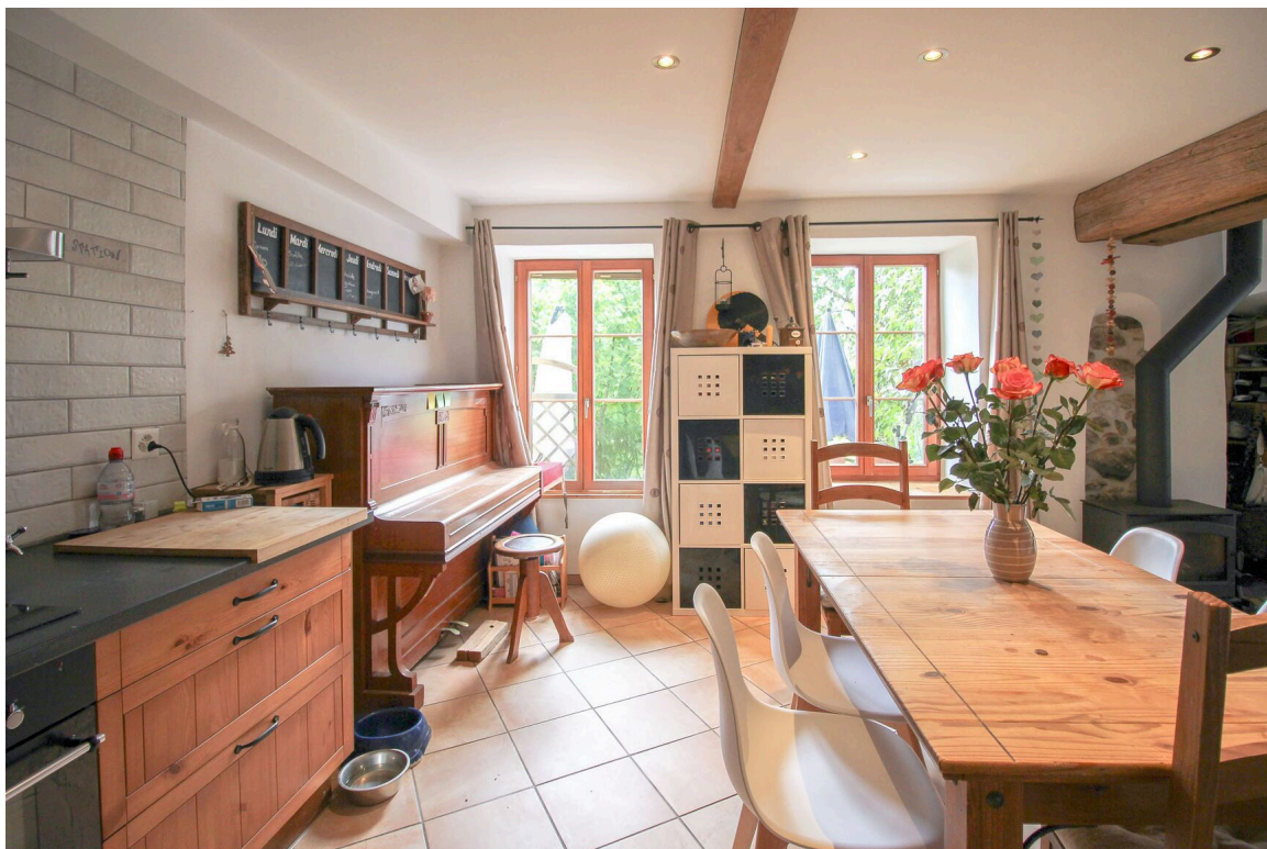
Appt de 5.5 pces - cuisine agencée ouverte