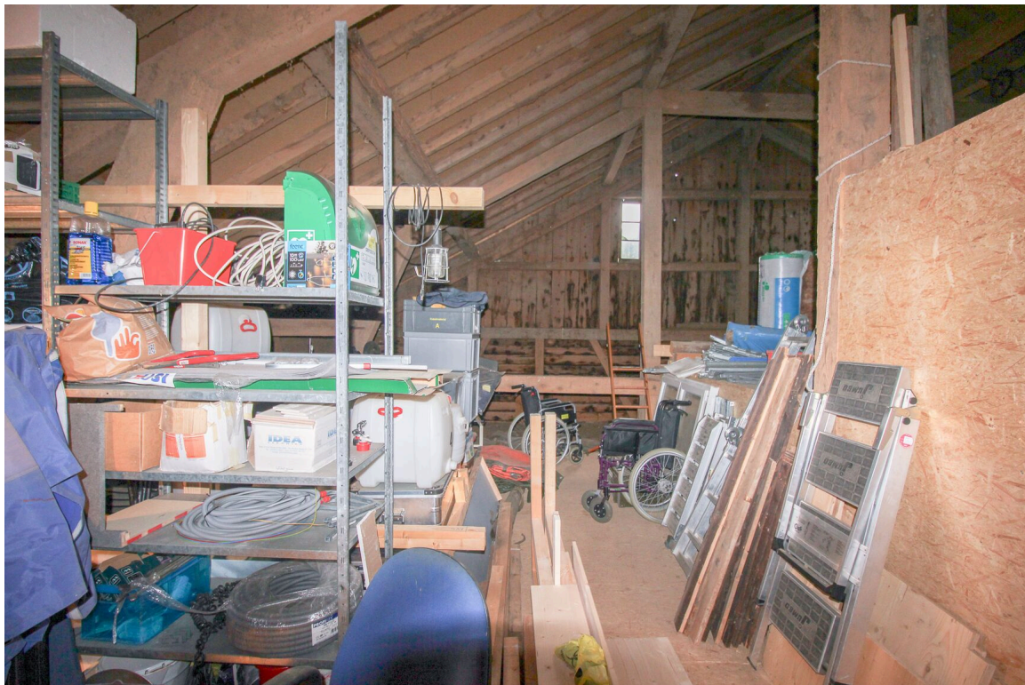
Rural - espace de stockage