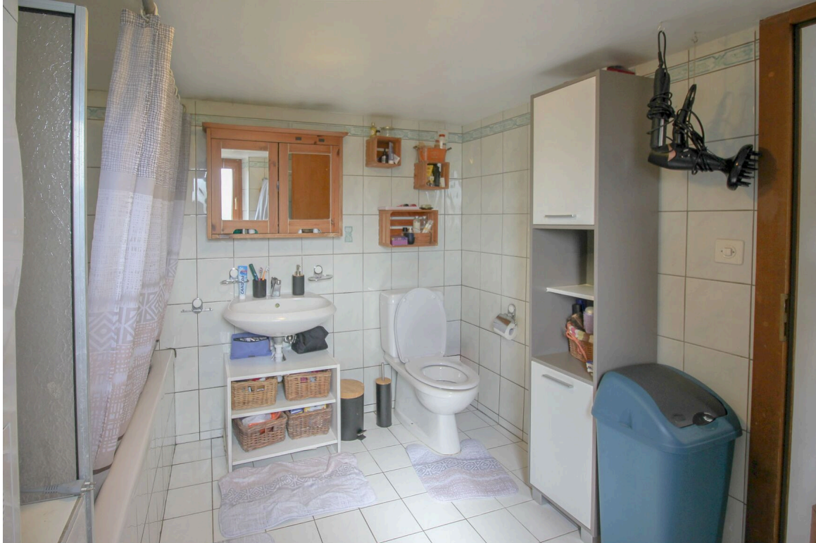
Appt de 5.5 pces - salle d'eau

TransCréa Sàrl Immobilier Conseils - Location - Vente