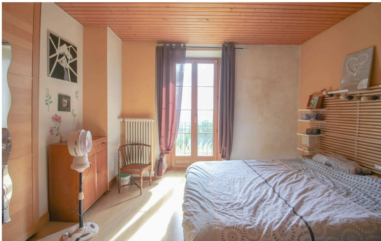
Appt de 5.5 pces - chambre no 1 avec accès au balcon exposé Sud