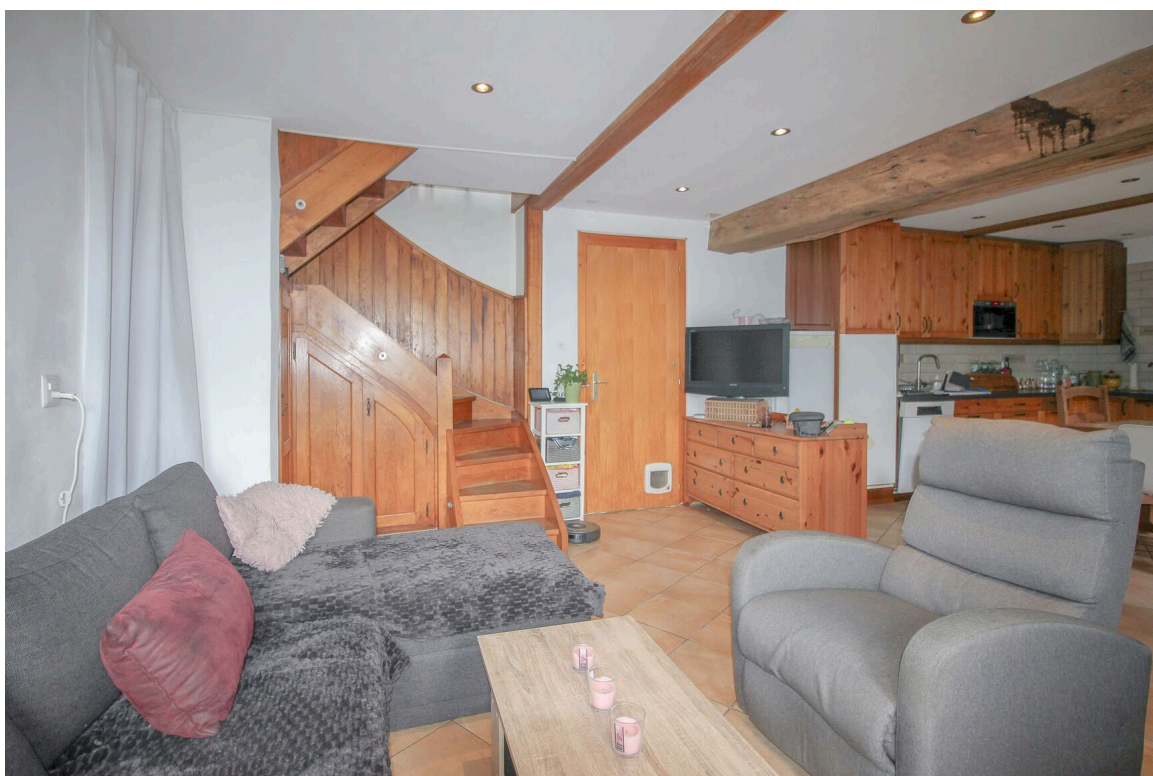
Appt de 5.5 pces - espace salon