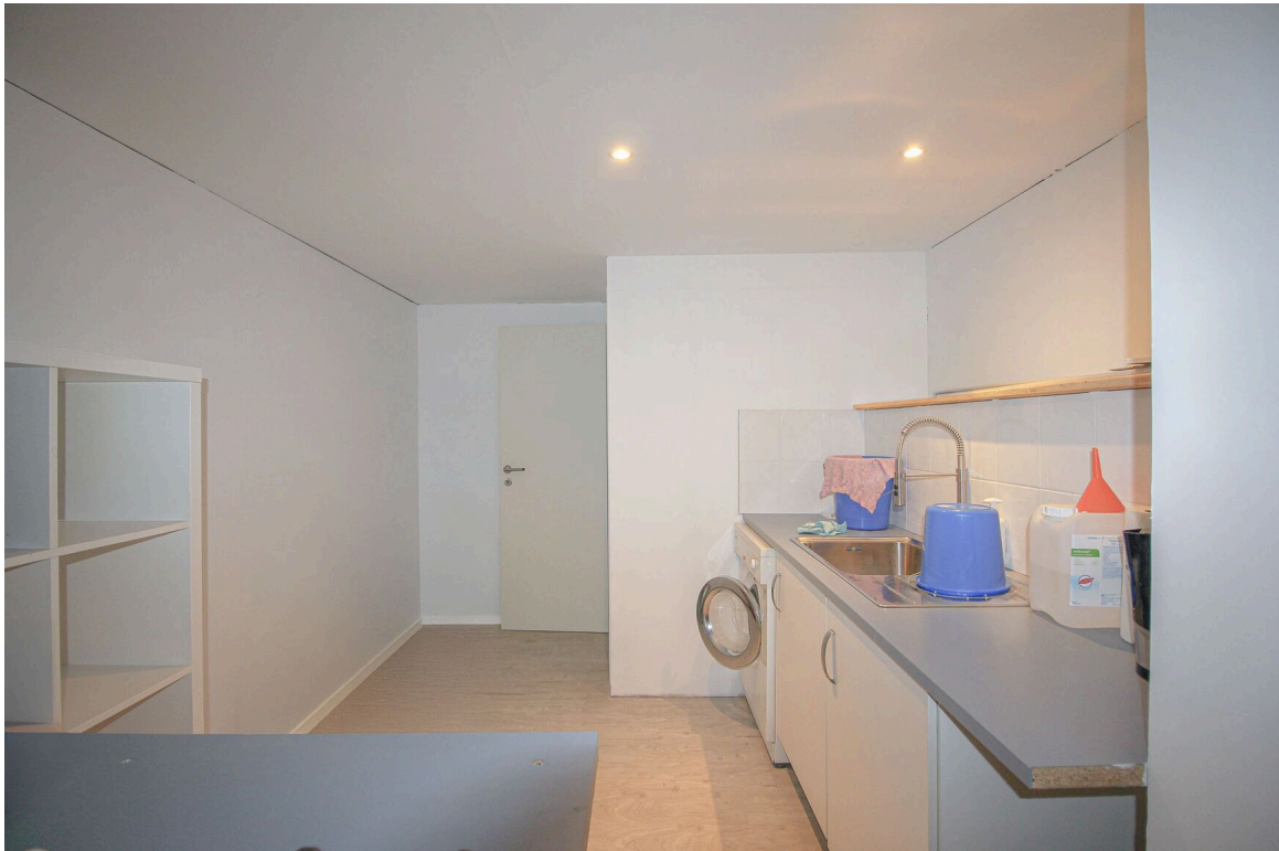
Rural - cuisine agencée