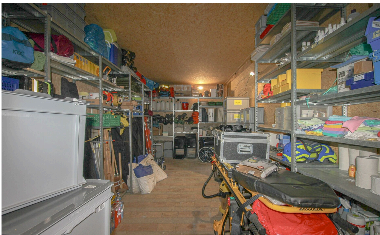
Rural - espace de stockage