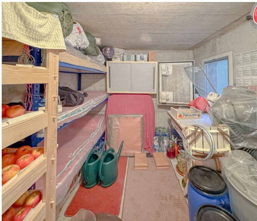
Rez inférieur : abri PC