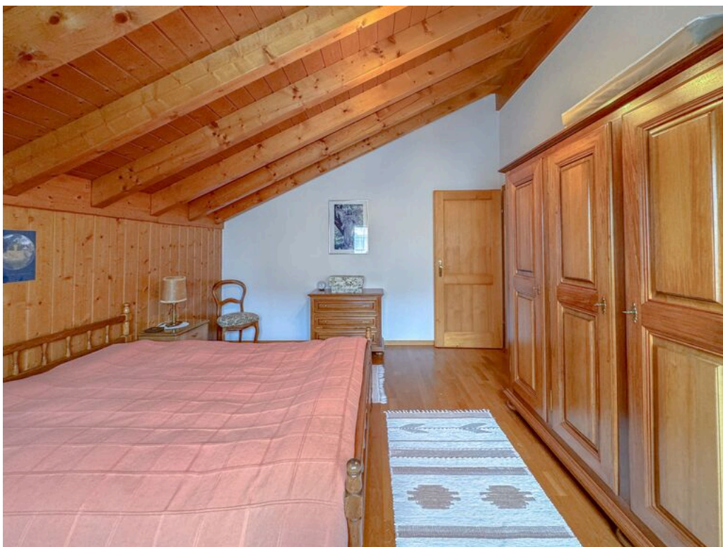
1er étage : chambre no 5