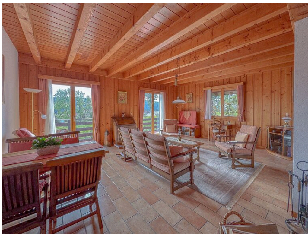
Rez supérieur : 1er séjour