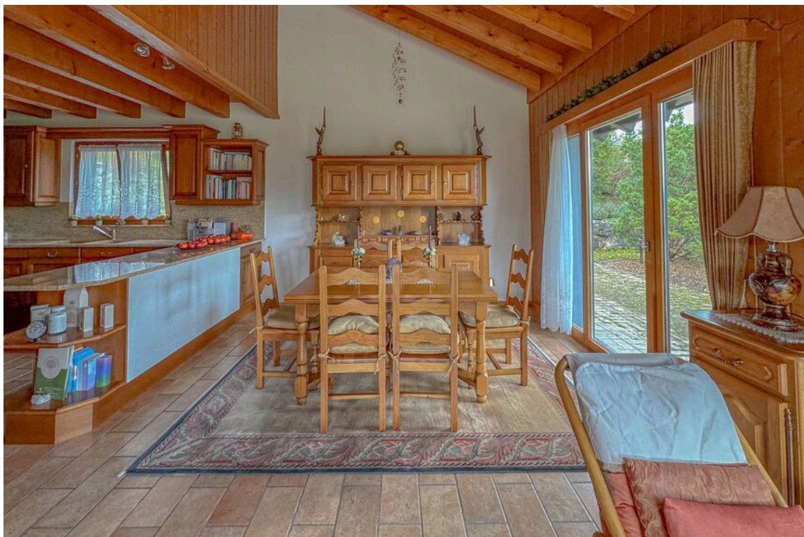
Rez supérieur : espace salle à manger