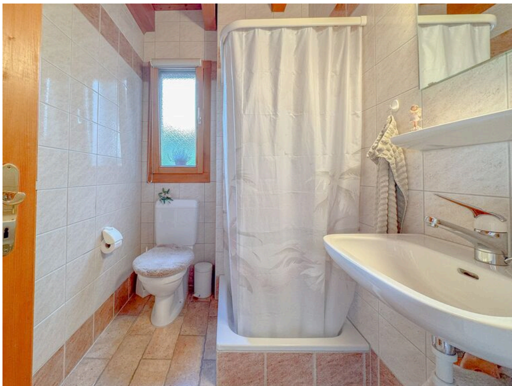
Rez supérieur : salle d'eau

TransCréa Sàrl Immobilier Conseils - Location - Vente