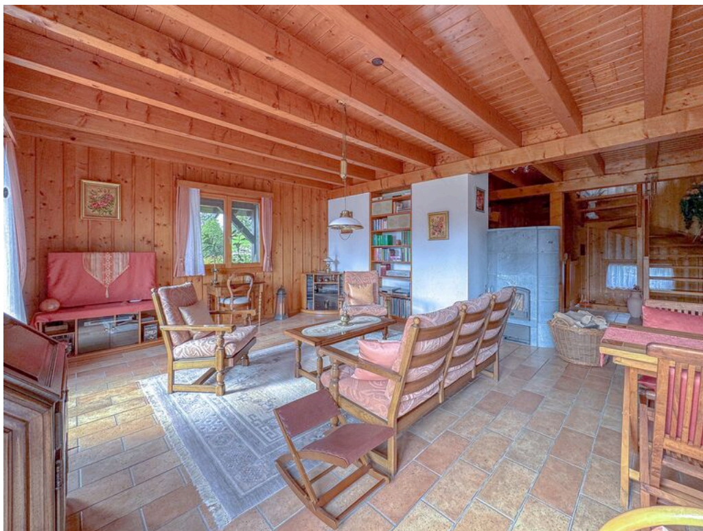
Rez supérieur : 1er séjour