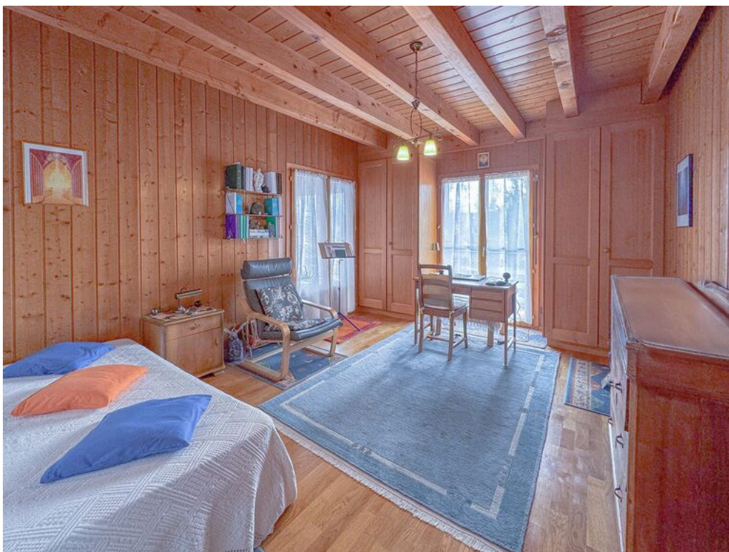
Rez supérieur : chambre no 2