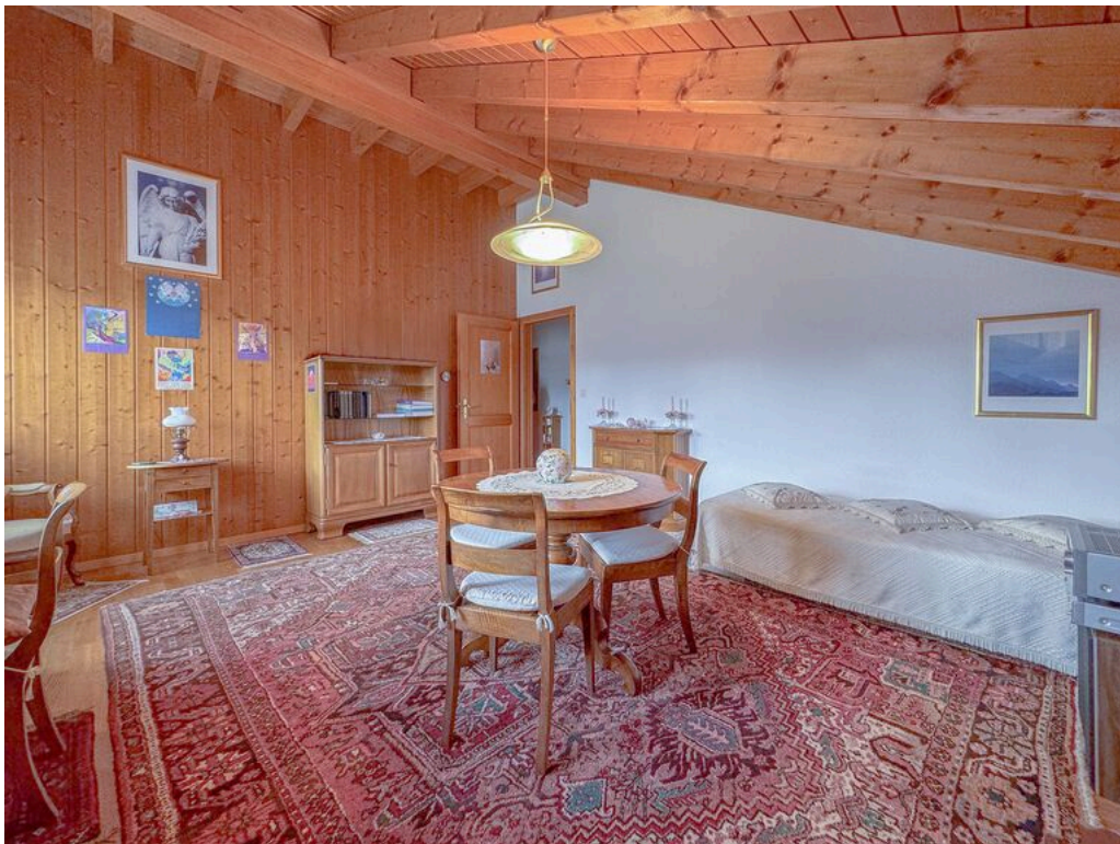
1er étage : chambre no 4