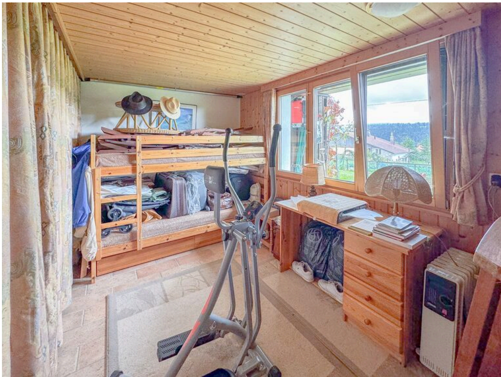
Rez inférieur : grande chambre