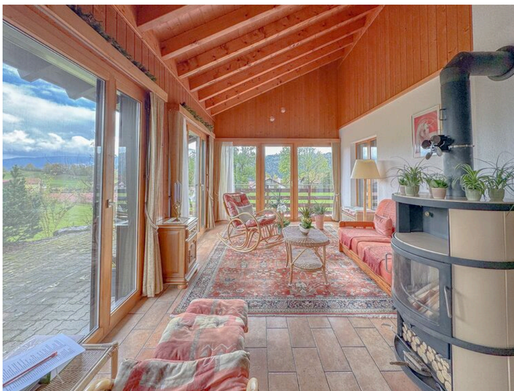
Rez supérieur : séjour avec accès direct à l'extérieur