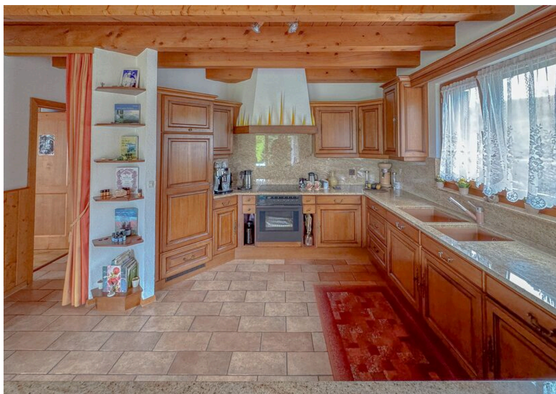
Rez supérieur : cuisine agencée ouverte