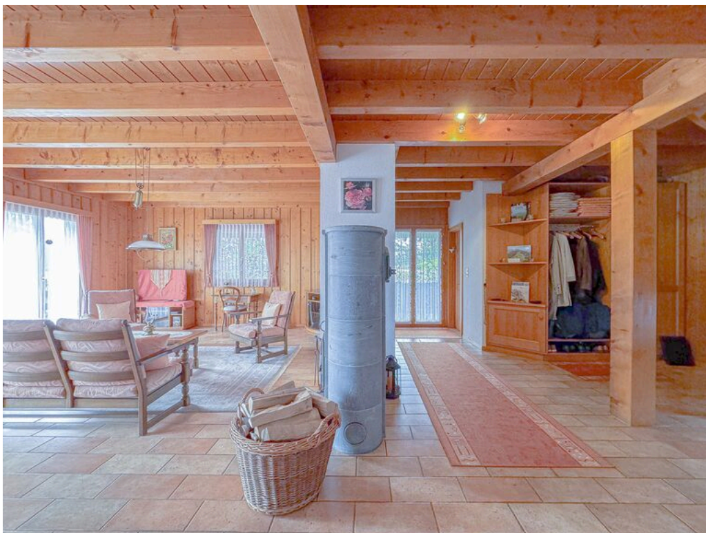
Rez supérieur : hall d'entrée ouvert sur la pièce à vivre