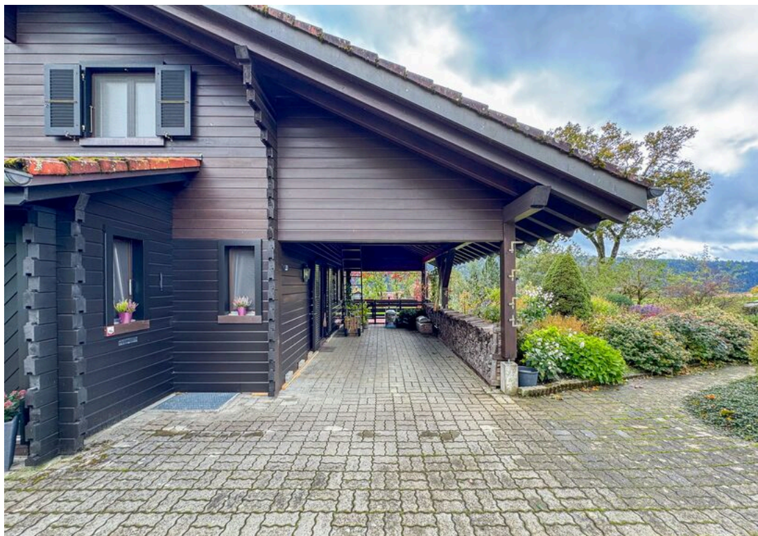
Couvert à voiture