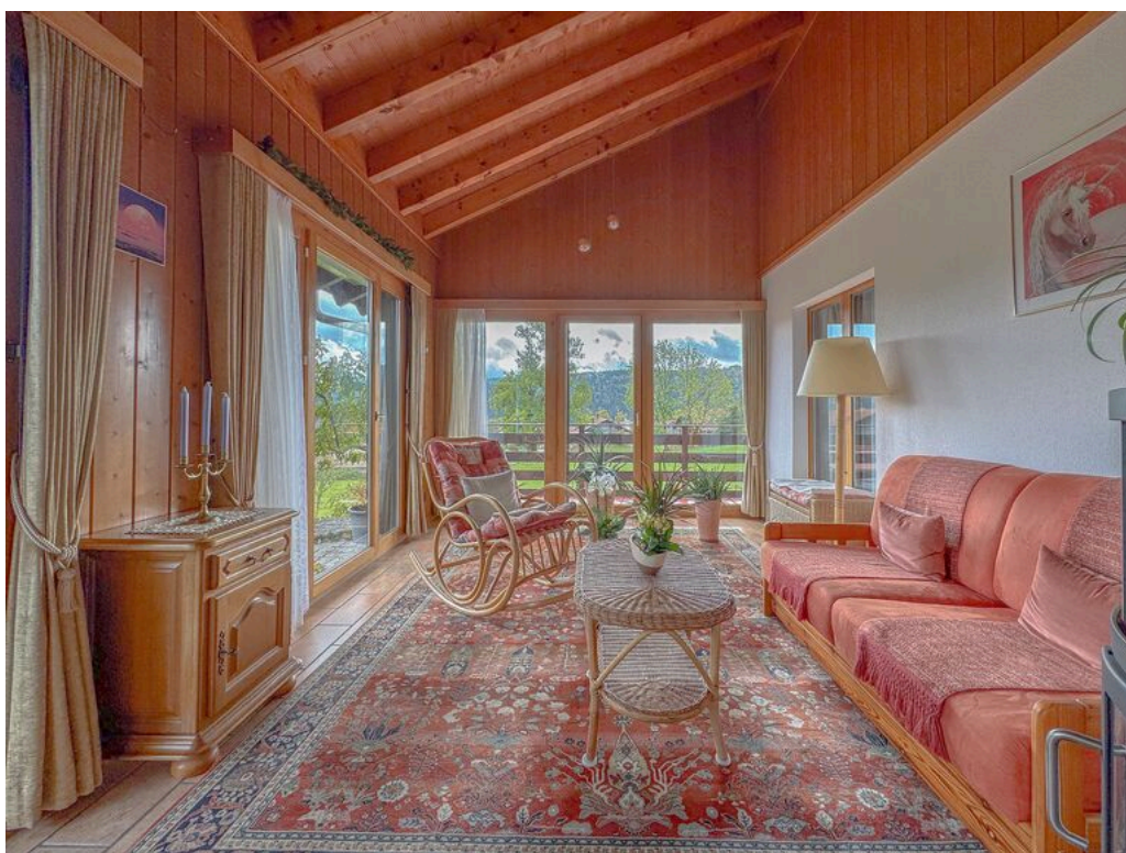
Rez supérieur : 2ème séjour