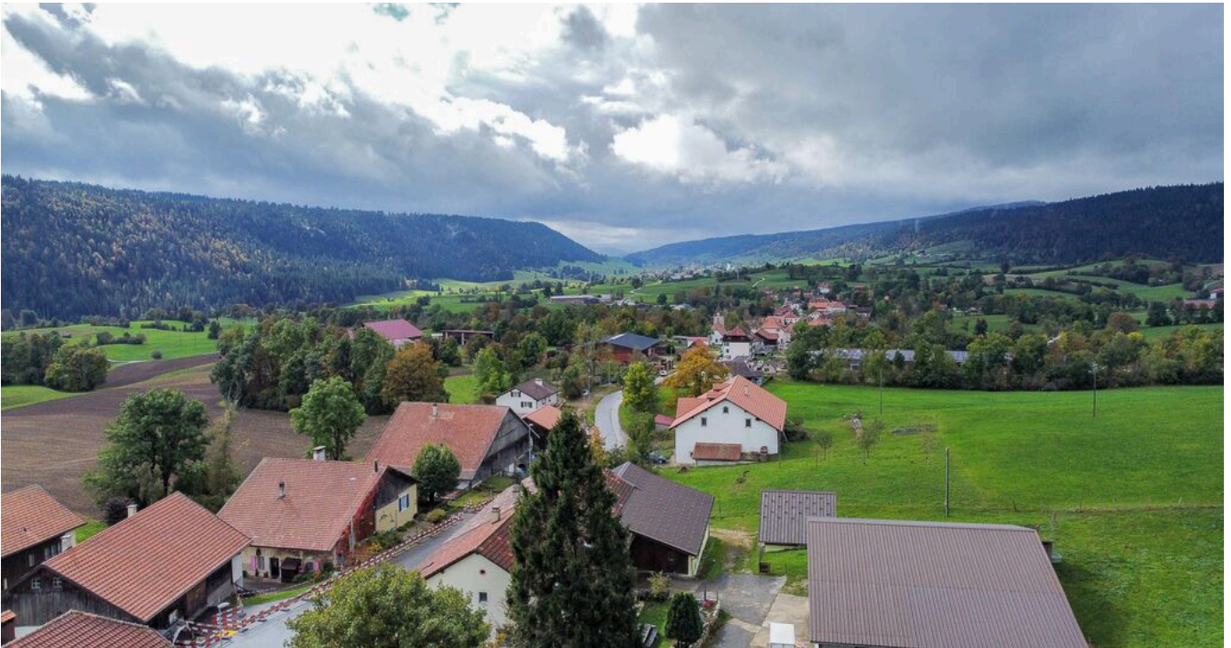
Vue aérienne sur Les Bayards