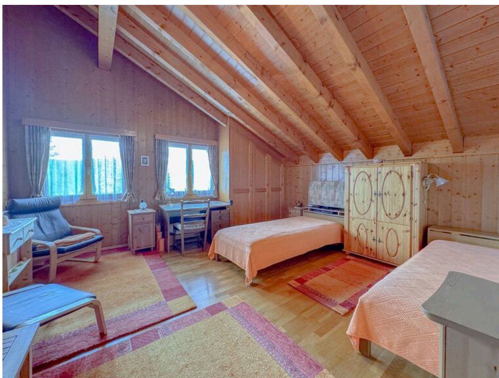
1er étage : chambre no 3