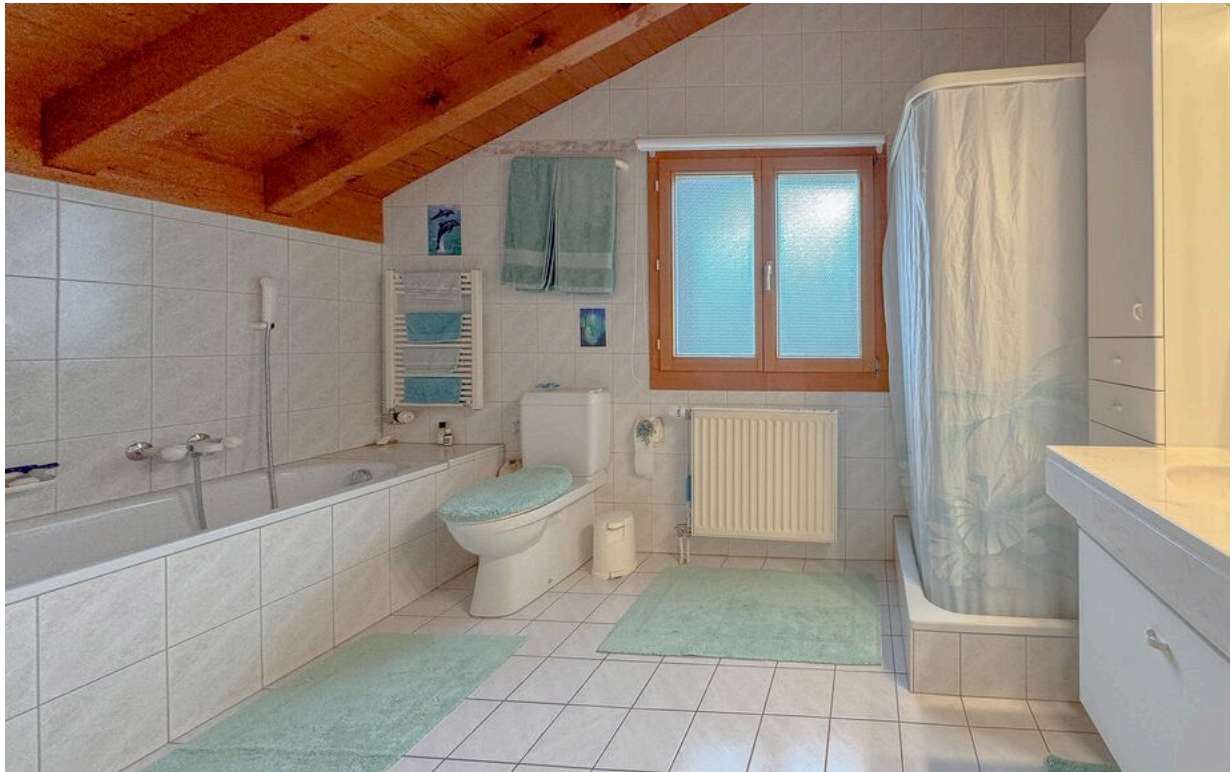
1er étage : salle d'eau

TransCréa Sàrl Immobilier Conseils - Location - Vente