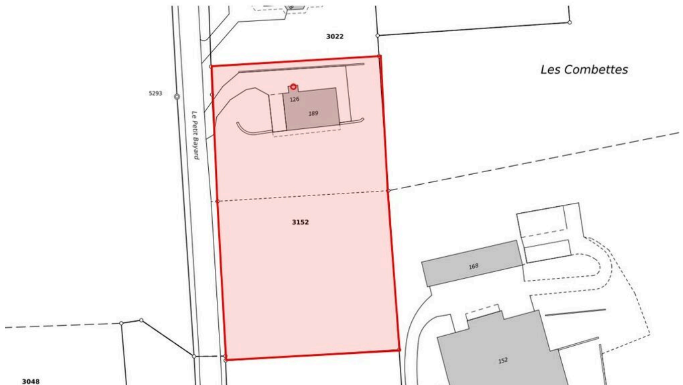
Détail du cadastre