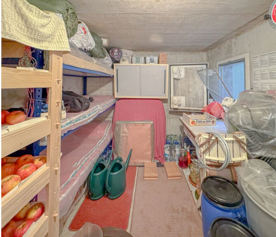
Rez inférieur : abri PC