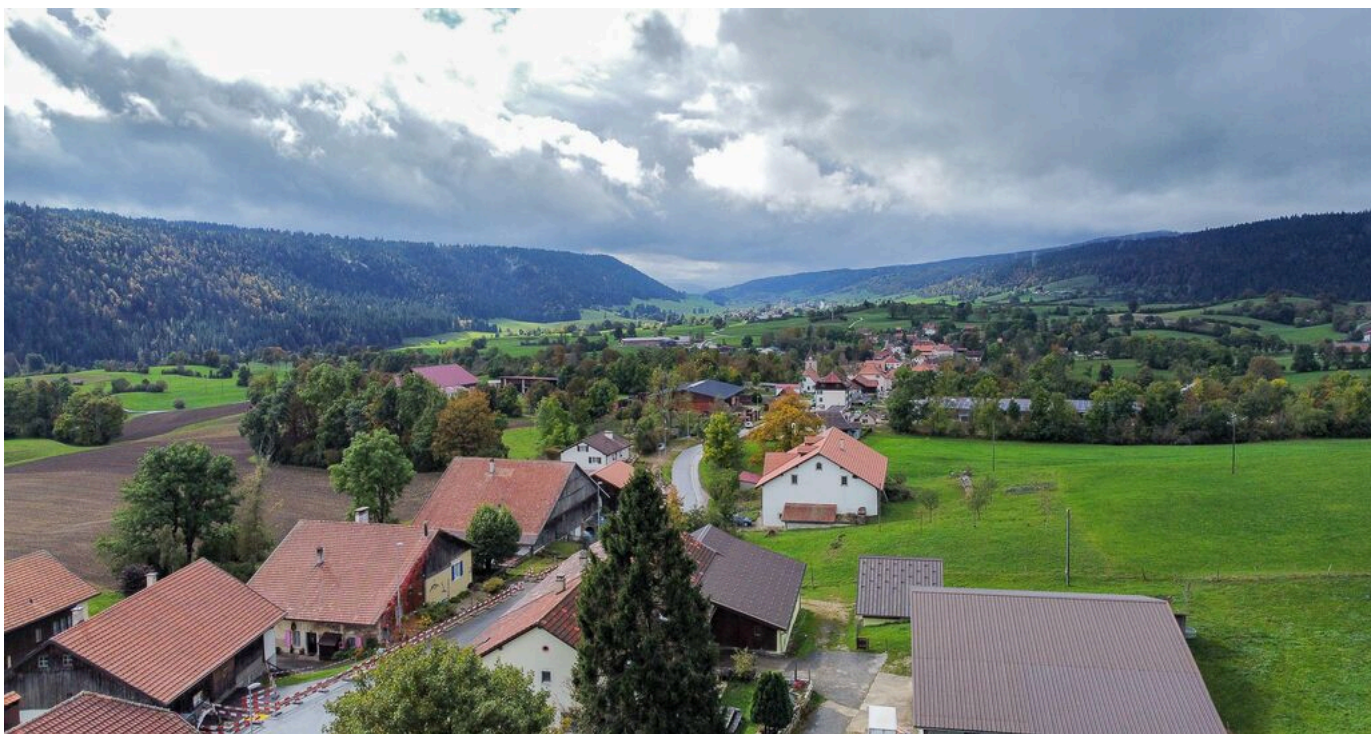
Vue aérienne sur Les Bayards