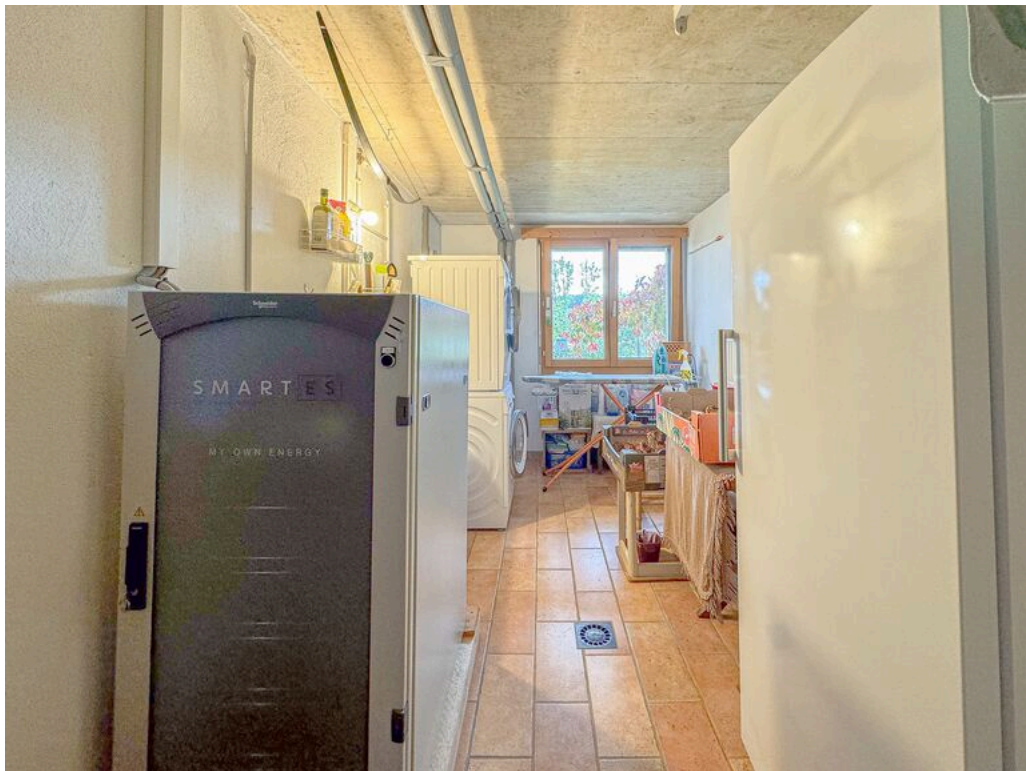
Rez inférieur : buanderie