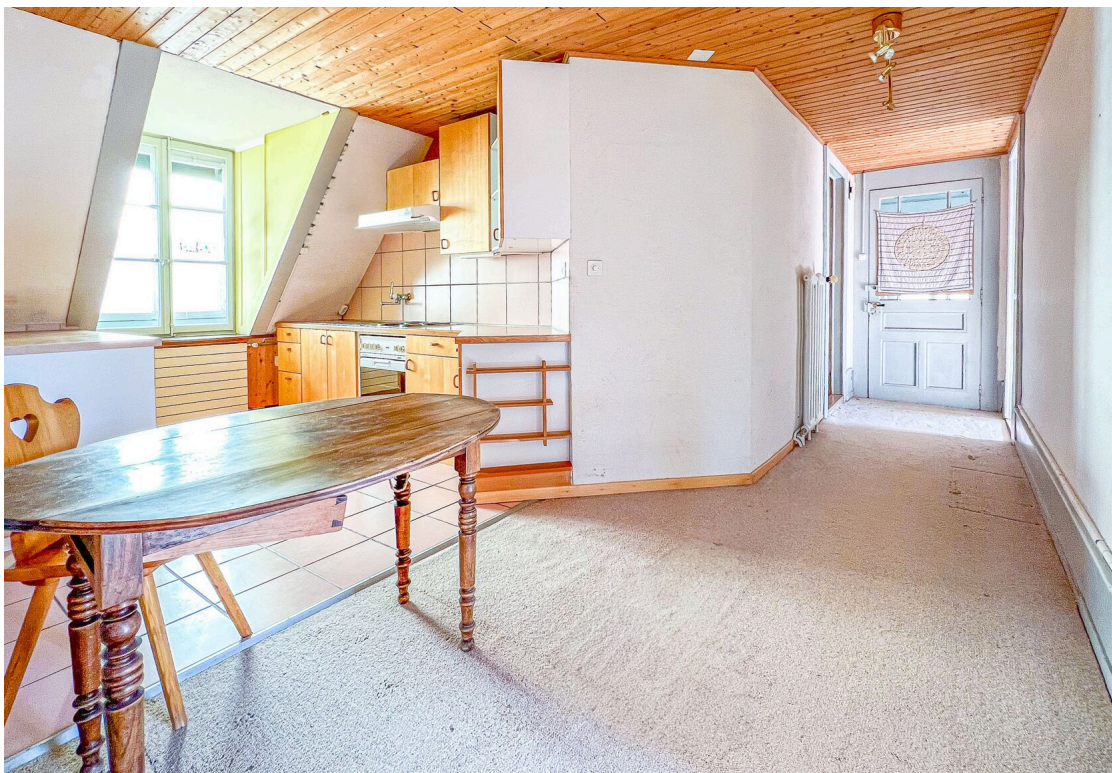
Cuisine agencée ouverte