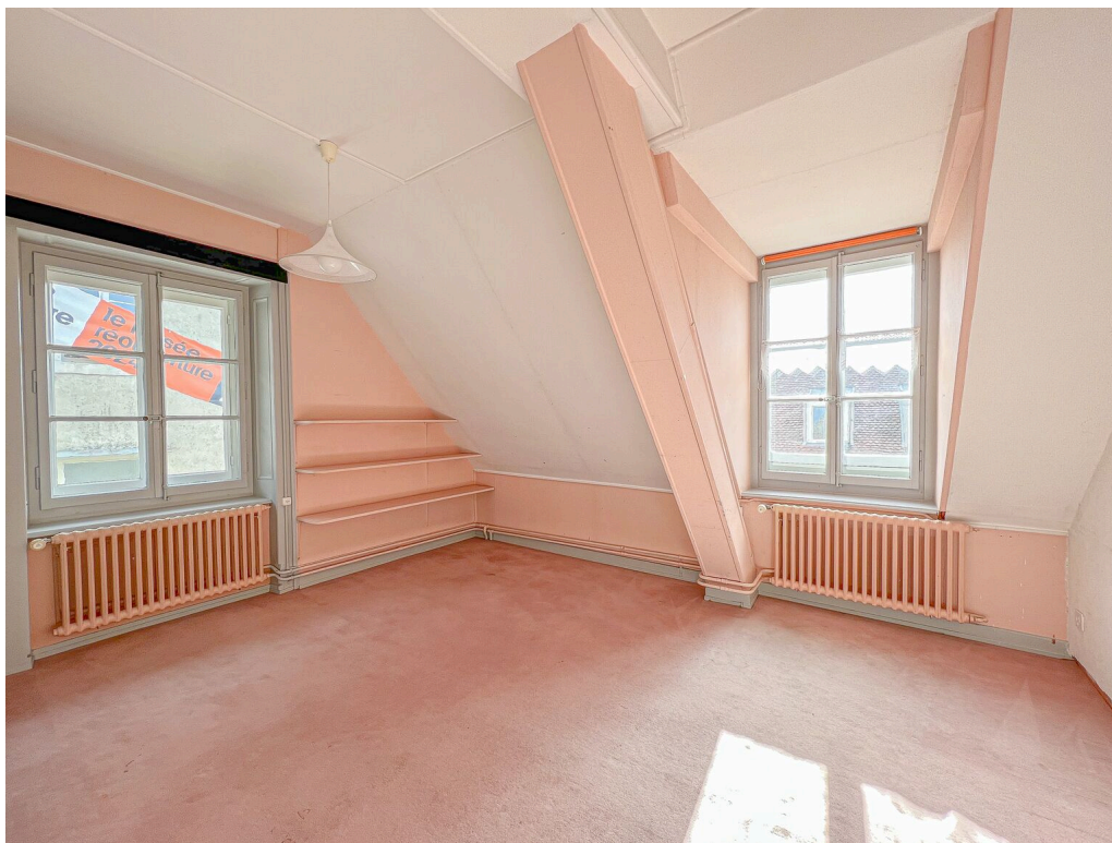
Chambre no 2