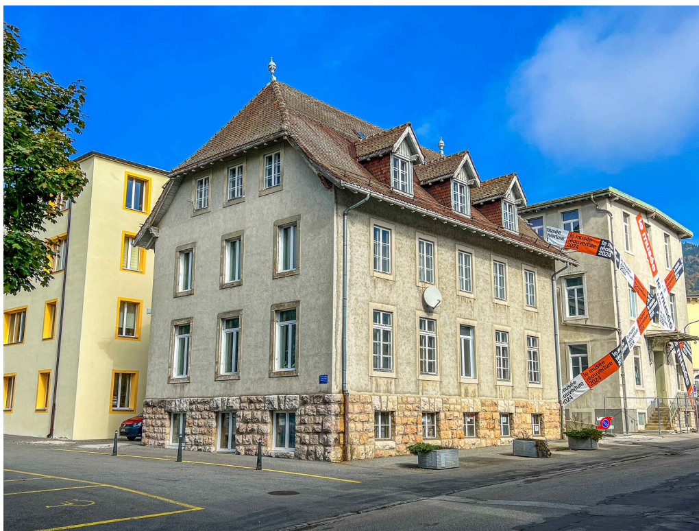
Vue du bâtiment