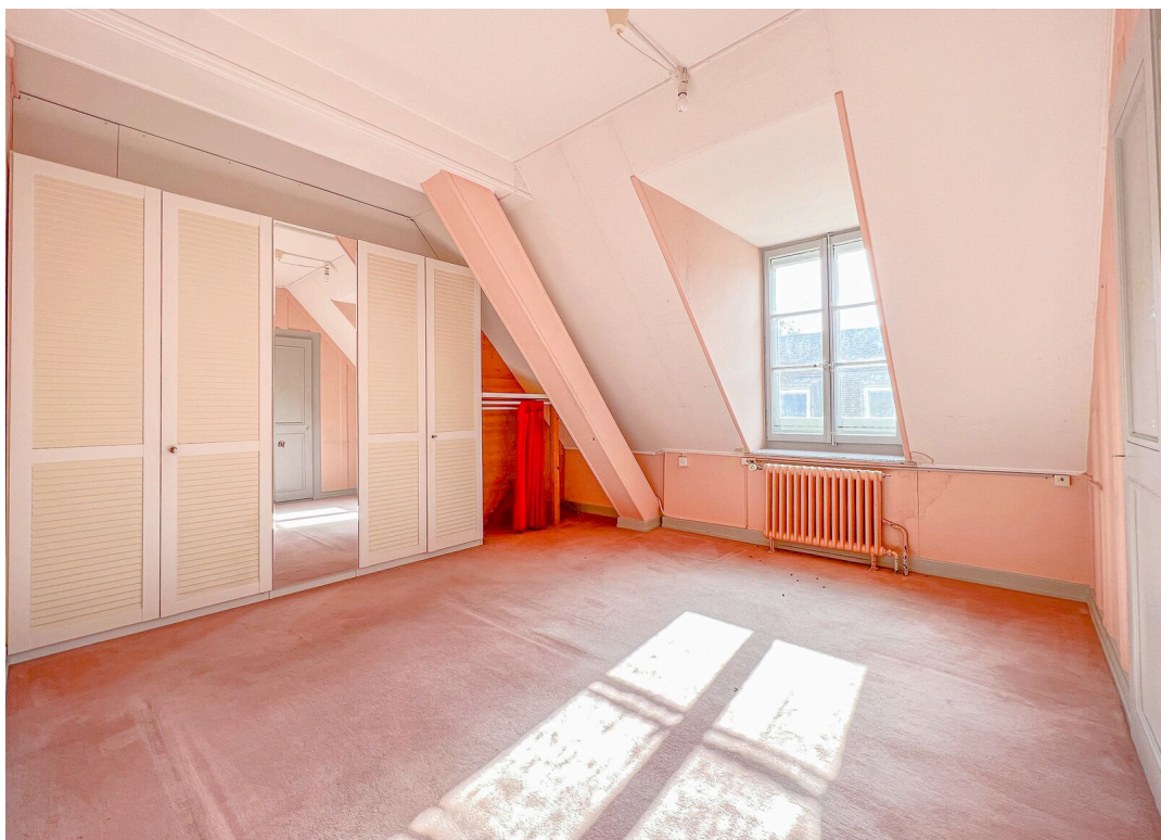
Chambre no 1