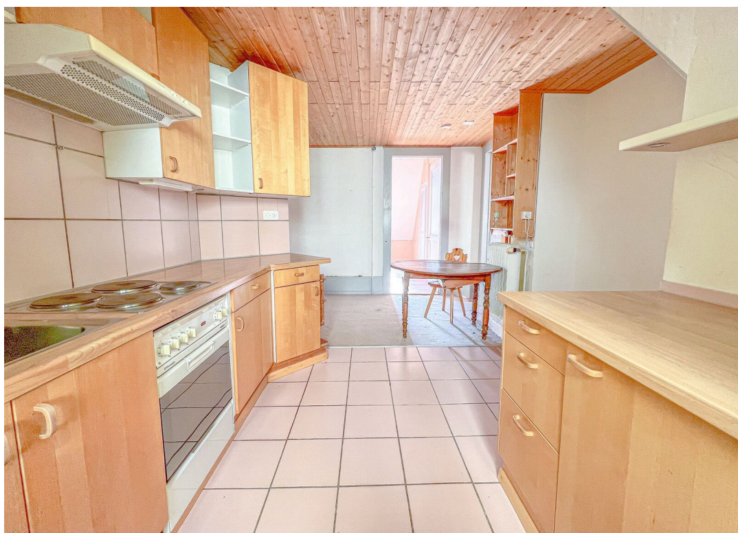
Cuisine agencée ouverte