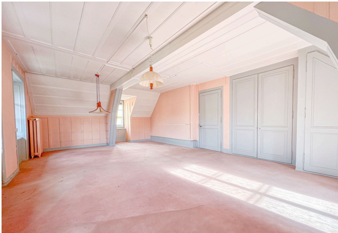
Grand salon lumineux