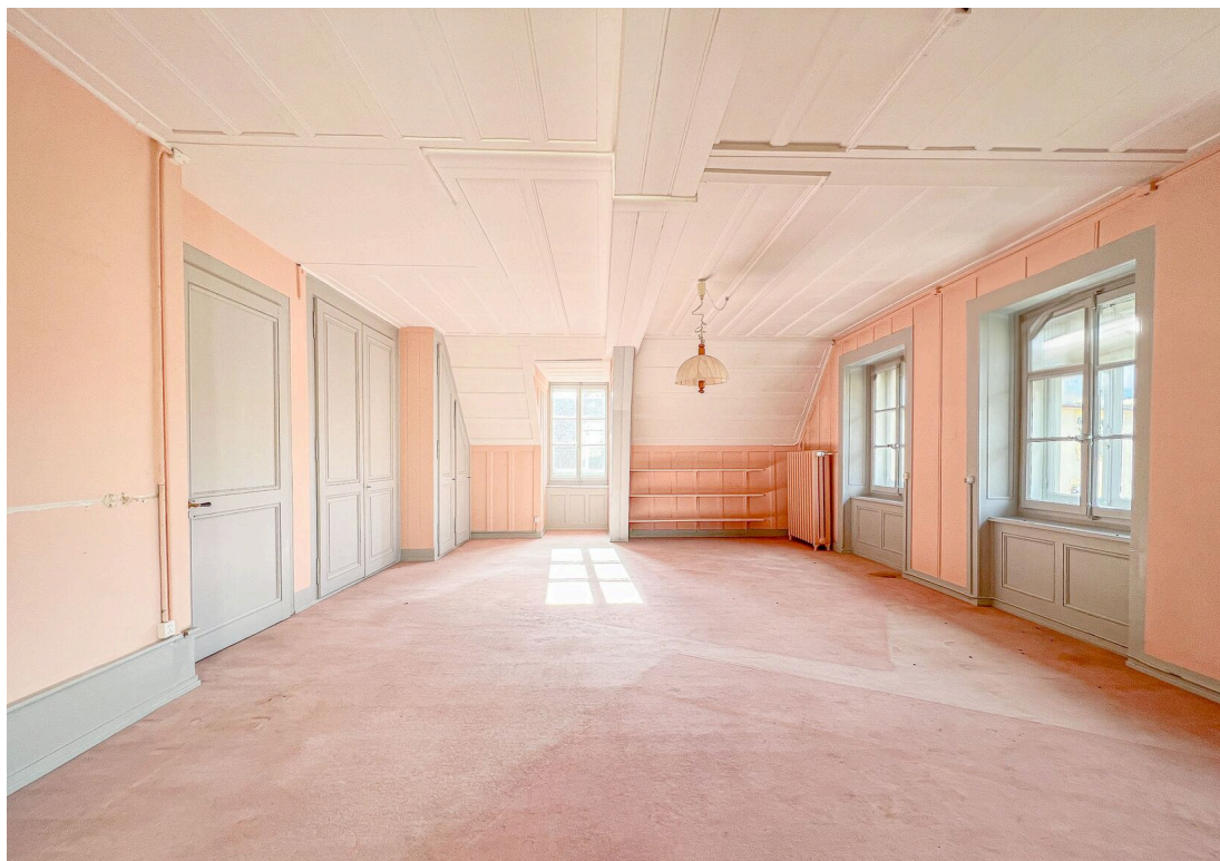
Grand salon lumineux