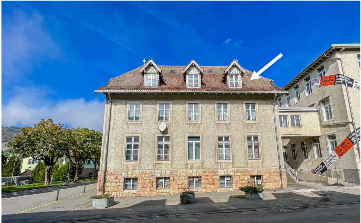
Vue de l'appartement